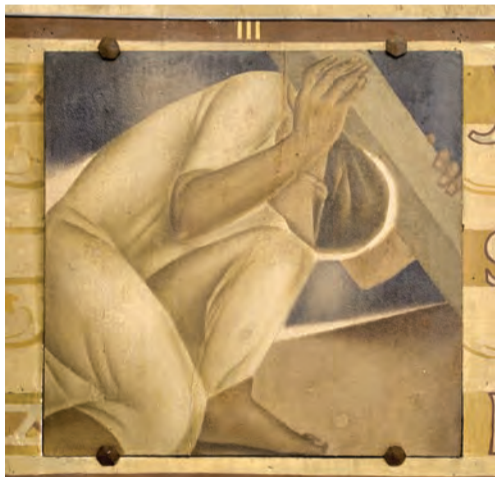
III ème station