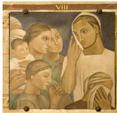
VIII ème station