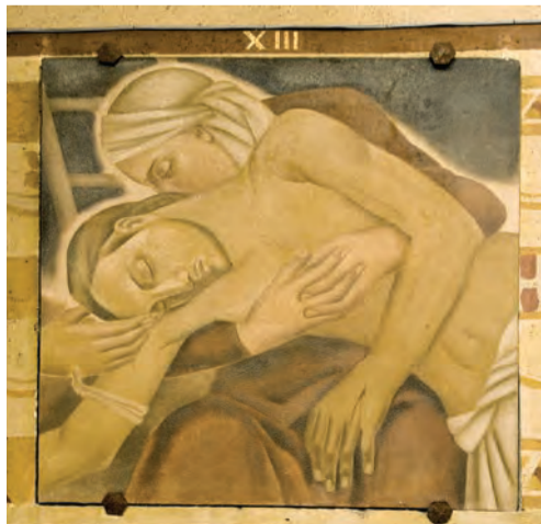
XIII ème station