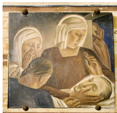
XIV ème station