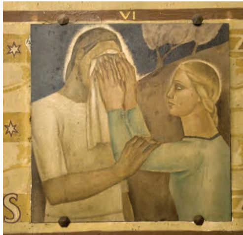
VI ème station