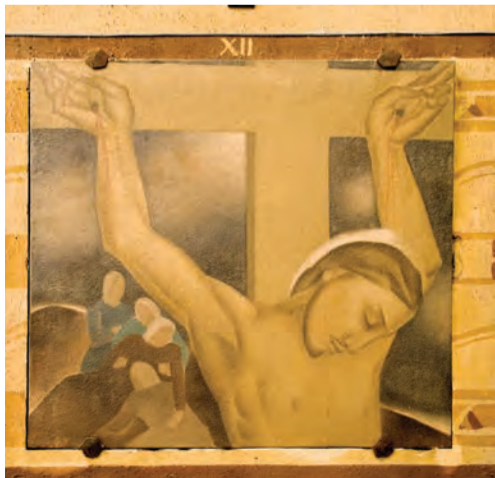
XII ème station